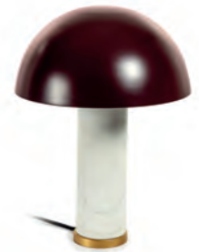
Lámparas de mesa de mármol y metal Valentine (75,99€) y Zorione (105€) de Kave Home.