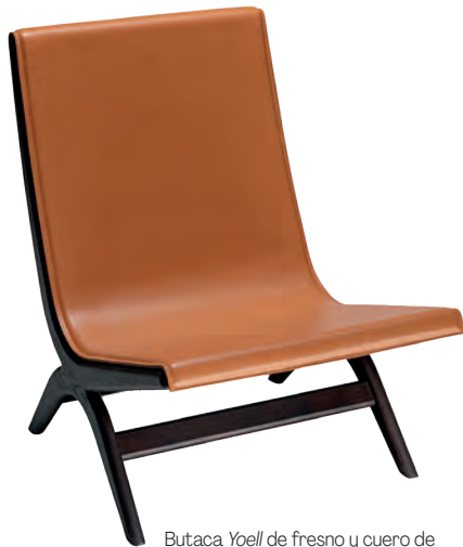
Butaca Yoell de fresno y cuero de Vincent Van Duysen para Molteni & C.