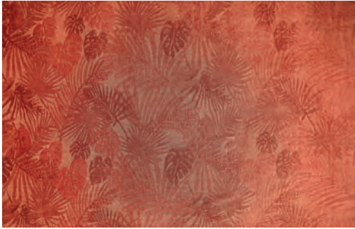
Jacquard aterciopelado Parvati con hojas de Güell Lamadrid.