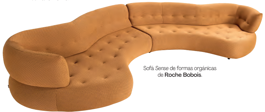
Sofá Sense de formas orgánicas de Roche Bobois.