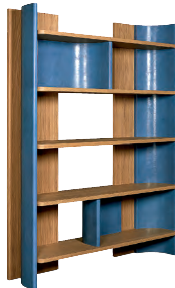
Librería Joni de madera y piel de Christophe Delcourt para Baxter.