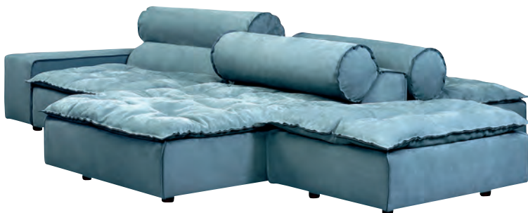
Sofá Miami Soft en composición de isla de Paola Navone para Baxter.

Las curvas evolucionan y se calman combinadas con rectas imperfectas y texturas de piel y metal.